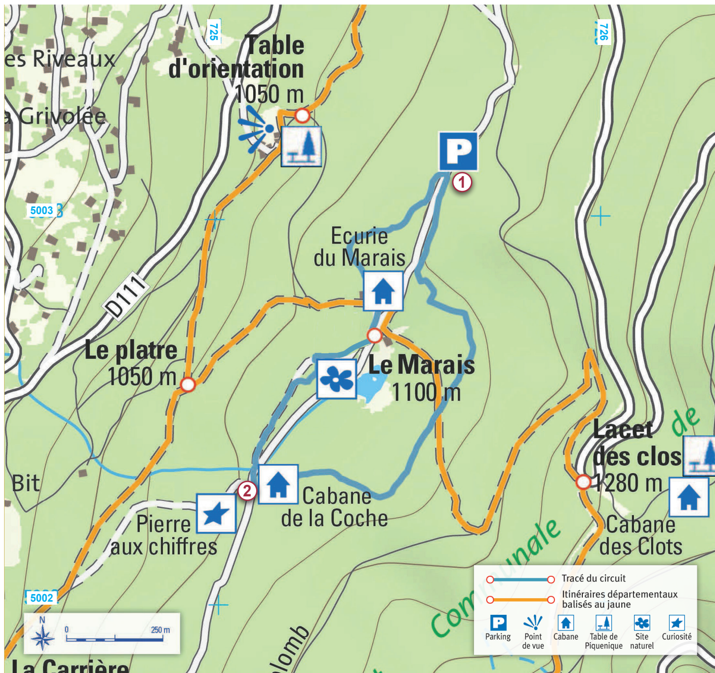
Les croisillons bleus correspondent au carroyage kilométrique UTM-WGS84 - Carte Mogoma